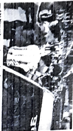
कांशी में गाइक चेक के दौरान भाजपा के कार्यकर्ताओं ने पुलिसकर्मियों को पीटा।

गाइक चेक की तो पार कर दी शराबखरा की हद काढ़े फाड़े